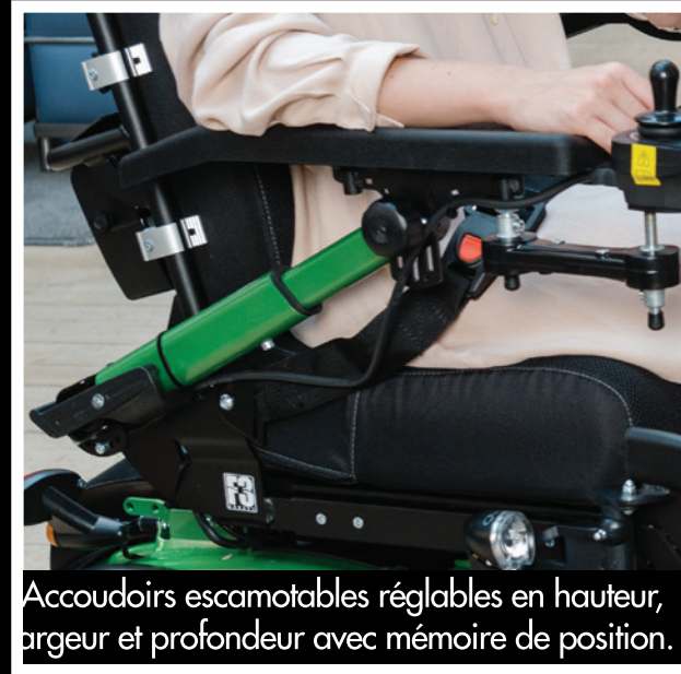
Accoudoirs escamotables réglables en hauteur, largeur et profondeur avec mémoire de position.