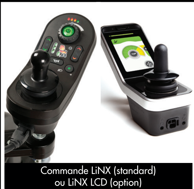
Commande LiNX (standard) ou LiNX LCD (option)