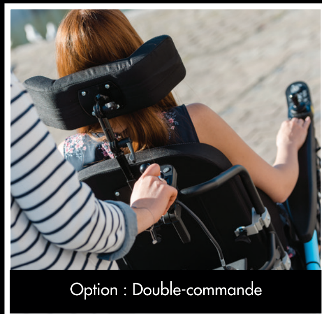
Option : Double-commande