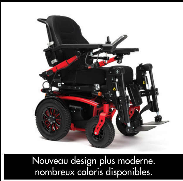
Nouveau design plus moderne. nombreux coloris disponibles.