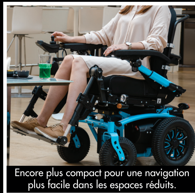
Encore plus compact pour une navigation plus facile dans les espaces réduits.