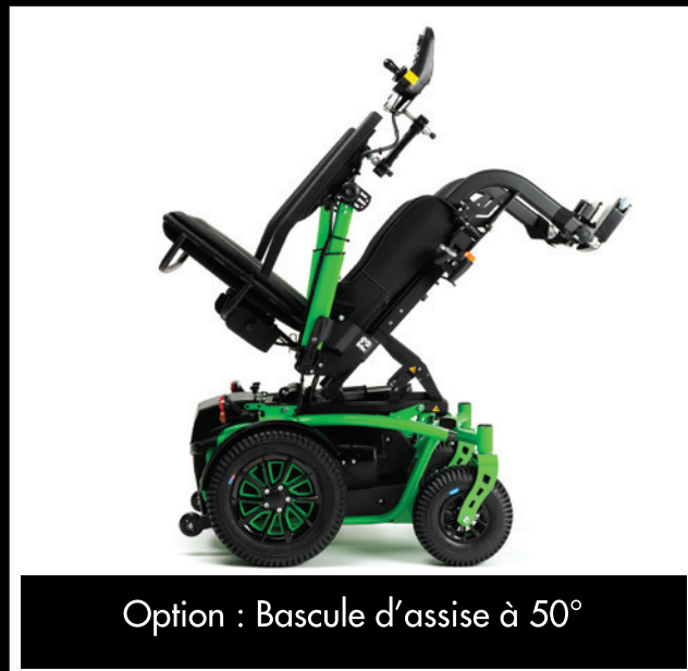
Option : Bascule d'assise à 50°