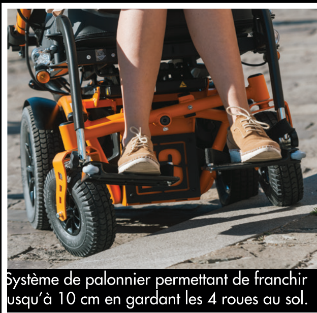
Système de palonnier permettant de franchir jusqu'à 10 cm en gardant les 4 roues au sol.