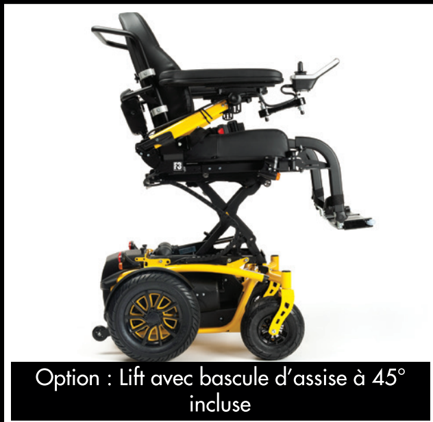
Option : Lift avec bascule d'assise à 45° incluse

Le fauteuil Forest 3 Advance est un fauteuil roulant électrique mixte intérieur / extérieur. Il sera très facile à manipuler à l'intérieur grâce à sa taille compacte et sera idéal pour l'extérieur grâce à sa stabilité et à sa capacité de franchissement. En plus de sa haute technicité, de ses nombreux réglages et de son niveau de confort élevé, le Forest 3 Advance dispose d'un design ultra-moderne et d'un grand choix de coloris.