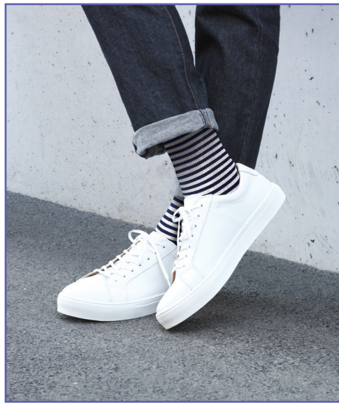
D'autres visuels sont disponibles dans le dossier photos.

« On a tous envie de se sentir fort, débordant de vitalité et libre de mener sa vie pleinement ».