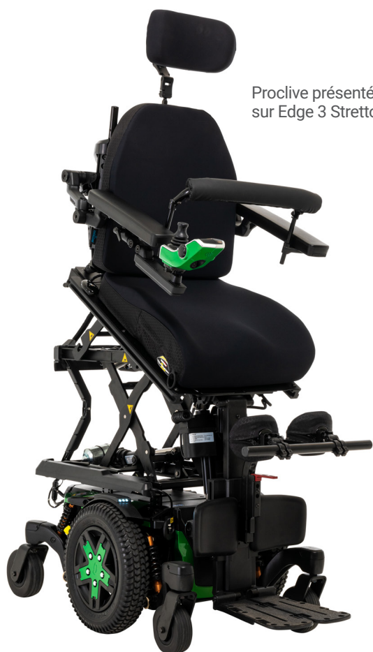
Proclive présentée sur Edge 3 Stretto