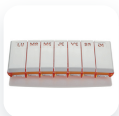
7 jours, 1 prise quotidienne