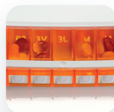
Contrôle des prises d'un simple coup d'œil