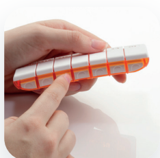
S'ouvre d'une simple pression