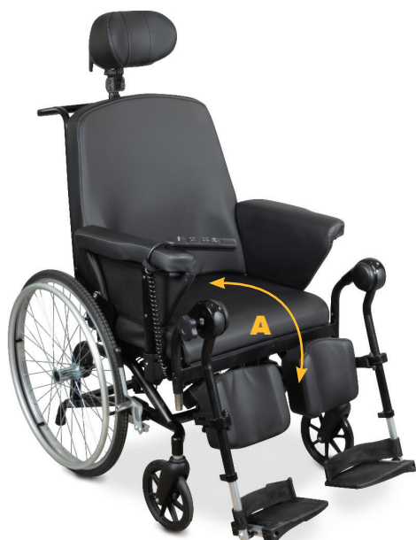
1 vérin électrique