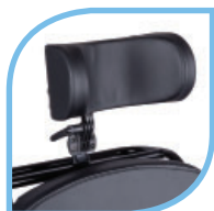
Appareil de soutien partiel de la tête.