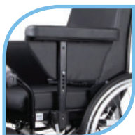
Accoudoirs réglables en hauteur.