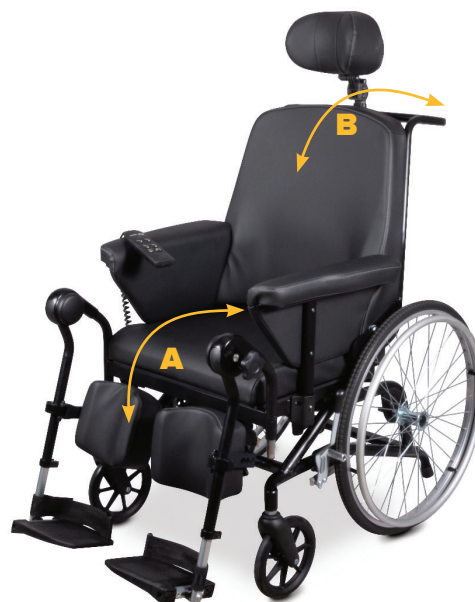
2 vérins électriques

(A) Réglage électrique de l'inclinaison de l'assise. (réglage de l'inclinaison du dossier par ressort à gaz)