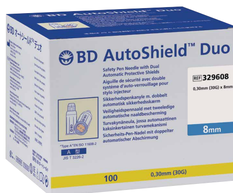
BD AutoShield™ Duo Aiguille sécurisée 8mm 0,30 mm (30G) x 8 mm