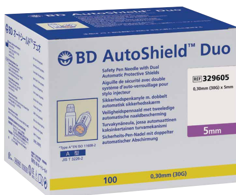
BD AutoShield™ Duo Aiguille sécurisée 5mm 0,30 mm (30G) x 5 mm